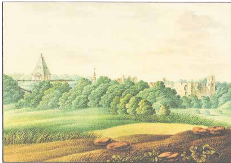
Tarvastu linnuse varemed kirikuga taustal XIX sajandil. Wilhelm Tuschi akvaarell

Mõnnaste küla Jõgeva talu mail katoliku-aegse kabeli ehk Annelombi kiriku asukohta.