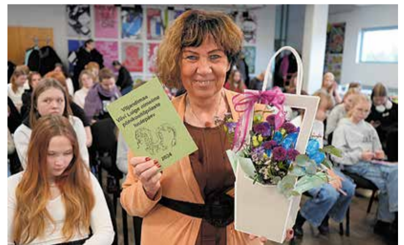
Viljandimaa põhikooliõpilaste 27. luulepäeval.