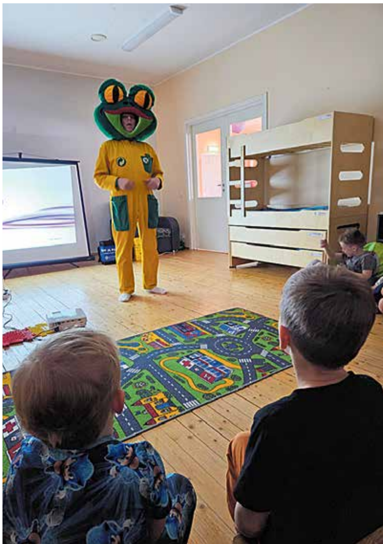
Lastel käis külas Keskkonnake.

Ega pikalt ei arutanudki ning asusime tegudele, et luua oma