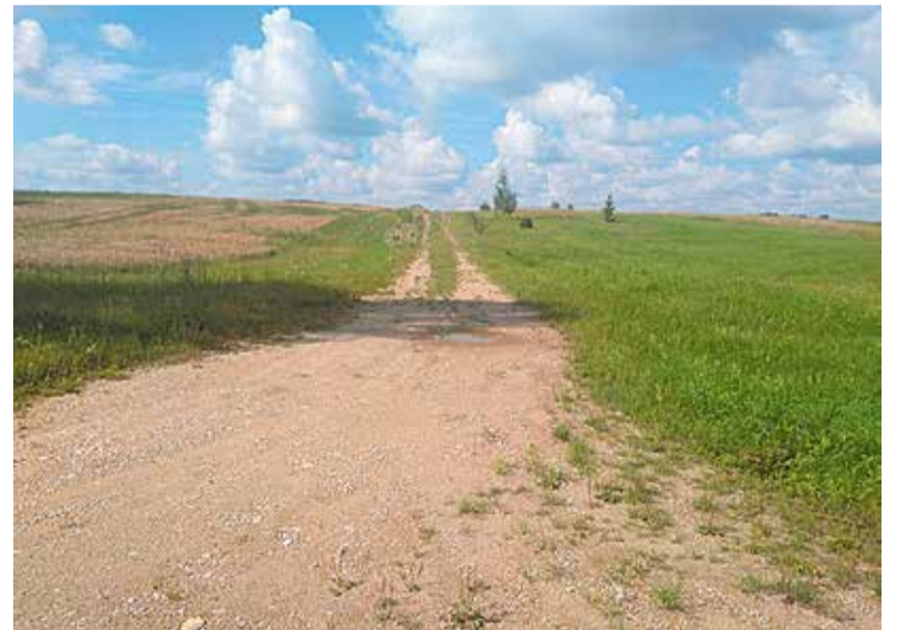
Toetust on võimalik taotleda erateede ehitus- ja/või remonditöödeks.